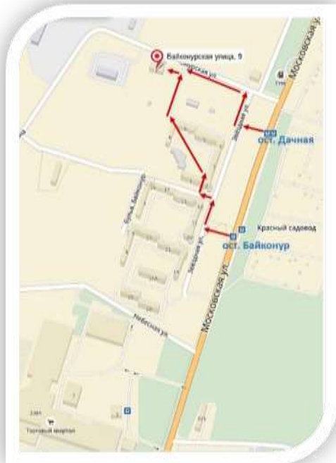
СХЕМА МЕСТОНАХОЖДЕНИЯ УМЦ ГОЧС КАЛУЖСКОЙ ОБЛАСТИ

ПРОЕЗД троллейбусами №№ 5, 6, 9 или автобусами №№ 9, 90, 91, 93, 97 до остановки «Дачная»