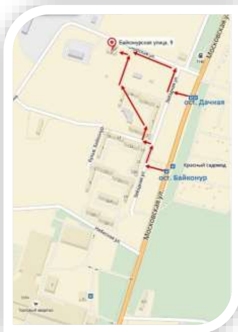
СХЕМА МЕСТОНАХОЖДЕНИЯ УМЦ ГОЧС КАЛУЖСКОЙ ОБЛАСТИ

Государственное казенное образовательное учреждение дополнительного образования «Учебно-методический центр по гражданской обороне и чрезвычайным ситуациям Калужской области»