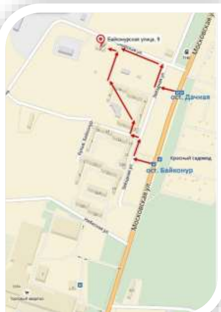
СХЕМА МЕСТОНаХОЖДЕНИЯ УМЦ ГОЧС КАЛУЖСКОЙ ОБЛАСТИ

ПРОЕЗД троллейбусами №№ 5, 6, 9 или автобусами №№ 9, 90, 91, 93, 97 до остановки «Дачная»